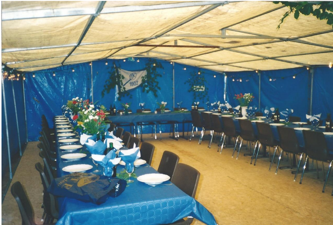
«Festsalen» står ferdig pyntet på bane 1 – Bergeløkka.